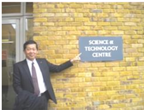
理科実験棟前にて